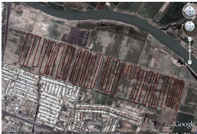
2-Расм. Катталиги 70 га атрофида бўлган тажриба майдонида EM 38 ускунаси ёрдамида олинган ўлчовлар сурати.