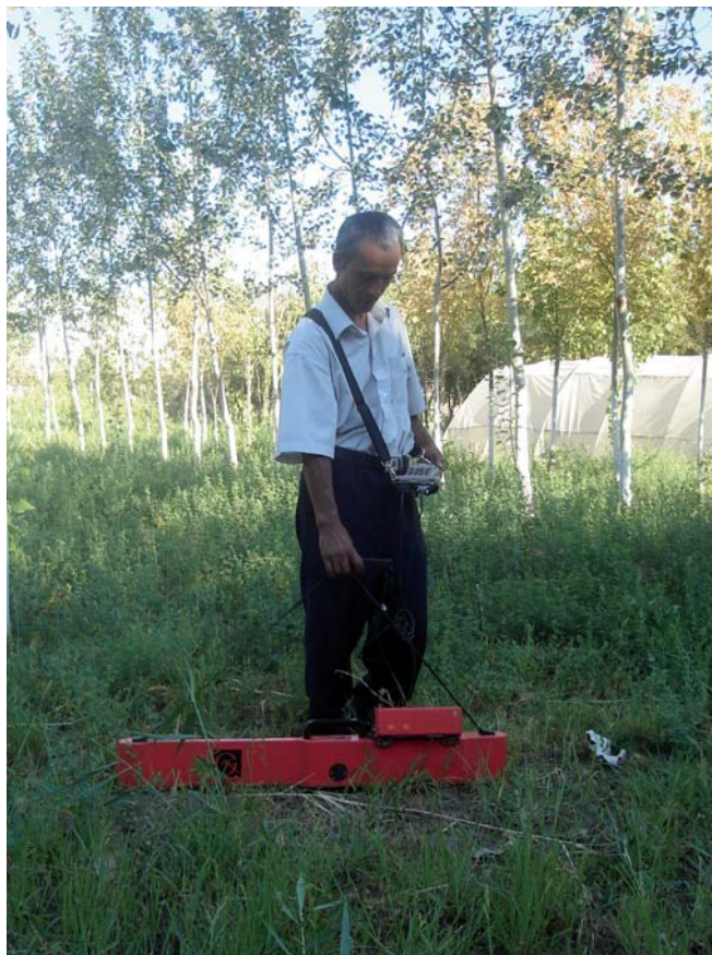
3-Расм. EM 38 ускунасининг дала оператори томонидан ишлатилиши.

Айни пайтда Марказий Осиёда тупроқ шўрланиши анъанавий кўп меҳнат талаб этадиган усулда аниқланади, яъни майдонларнинг маълум бир жойидан тупроқ намуналари олинади ва лабораторияда таҳлил қилинади. Ушбу жараён узок вақтни олади. Шунингдек, тупроқ шўрланишини таҳлил қиладиган анъанавий услубда ҳар бир намунанинг умумий қаттиқ қолдиқ миқдори ҳисобга олинади. Оқибатда шўрланиш хариталари узок вақт давомида тайёрланади ва шу боис, уларнинг қўлланилиш самараси пасаяди. EM асбоби деструкциясиз ва узлуксиз ўлчовларни олиш имконияти мавжуд ва юқори аниқликда фазовий ўзгаришларни аниқлайди. Шундай қилиб, EMнинг афзал томонлари қуйидагилардан иборат: (i) тезкор ва деструкциясиз ўлчовлар; (ii) мониторинг учун