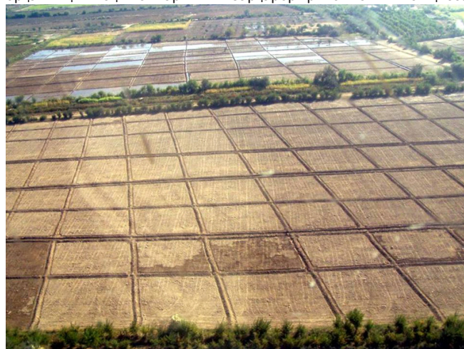
1-Расм. Экишдан олдин дала кўриниши.

Минтақада ер ва сув ресурсларидан фойдаланишни иқтисодий ва ижтимоий жиҳатдан қайта куриш бўйича ислохотларни, ўтказилган илмий тадқиқотлар асосида, режалаштиришни моделлаштириш иқлим ўзгаришининг салбий таъсирини олдини олиш ва шу орқали қишлоқ жойларининг барқарор ривожланишига ҳисса