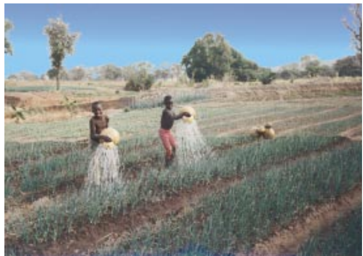
Bewässerungsfeldbau gewinnt auch in Westafrika zunehmend an Bedeutung

ge verursachen. Der Volta-See ist ein künstlicher See im unteren Beckenbereich, der über 90% des elektrischen Stromes in Ghana liefert. Trockenheit, wie beispielsweise in 1998, hat direkte Auswirkungen auf den See und verringert die Stromproduktion und damit die industrielle Produktion in Ghana. Um die wachsende Bevölkerung in der Region zu ernähren, muß die künstliche Bewässerung in Nord-Ghana und Burkina Faso stark entwickelt werden. Allerdings vermindert mehr Bewässerung die für die Stromproduktion flußabwärts verfügbare Wassermenge, so daß eine Konkurrenzsituation zwischen ländlicher und städtischer Entwicklung entsteht.