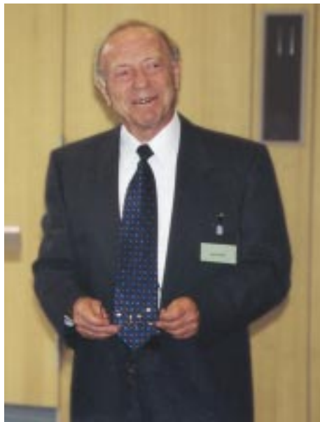
Dr. Daniel Hillel, Universität Massachusetts hielt im Rahmen der ZEF-Tagung einen Vortrag zum Thema „Terra Aqua Vitae - The Role of Soil and Water in Supporting Civilization“

Trotz Craswell's Feststellung macht diese Aufgabe weitere Forschung erforderlich, besonders bezüglich der Bedeutung der Qualität des Ausgangsmaterials, der Rolle des unterirdischen im Vergleich zum oberflächlich aufgebrauchten („gemulchten“) Materials, oder die oft übersehene Wichtigkeit von Exsudaten der Pflanzenwurzeln. Sobald der Mensch ein Landnutzungssystem einführt, wird die Vielfalt der Bodenorganismen drastisch reduziert.