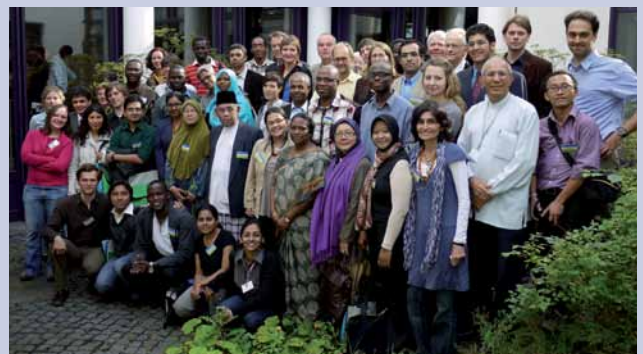
Teilnehmer der RLC-Konferenz am ZEF.

Das ZEF wird offizieller internationaler Campus des „Right Livelihood Award“, auch bekannt als Alternativer Nobelpreis. Dies wurde während einer Konferenz in Bonn im September 2010 anlässlich des 30-jährigen Jubiläums des Preises vereinbart. Partner dieser Vereinbarung sind außer dem ZEF: die Universität Bonn, das Right Livelihood College (RLC) und der Deutsche Akademische Austauschdienst (DAAD). Es gibt drei weitere RLC Standorte weltweit: Malaysia, Schweden und Äthiopien.