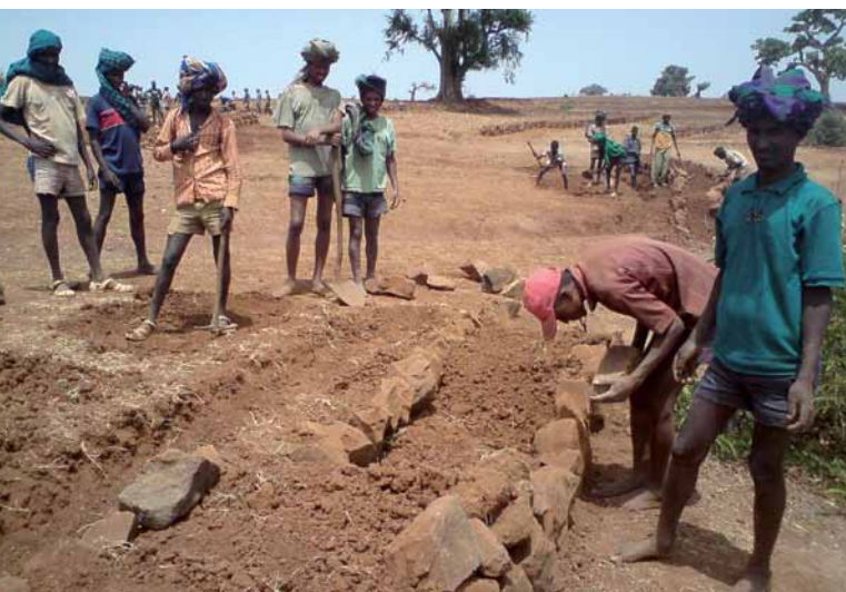
Das Bauen von Terrassierungen ist eine Adaptationsstrategie an den Klimawandel durch die lokale Bevölkerung in Äthiopien.

Das Projekt „Re-thinking water storage for climate change adaptation in sub-Sahara Africa“ befasst sich mit Wasserspeicheroptionen als Anpassungsstrategie an den Klimawandel in Ghana und Äthiopien. Das ZEF startete das Projekt mit u.a. der Universität Köln im April 2008. Es wird vom BMBF finanziert. Das übergreifende Projektziel