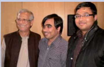
Yunus mit Studenten am ZEF.

Professor Muhammad Yunus besuchte am 6. November