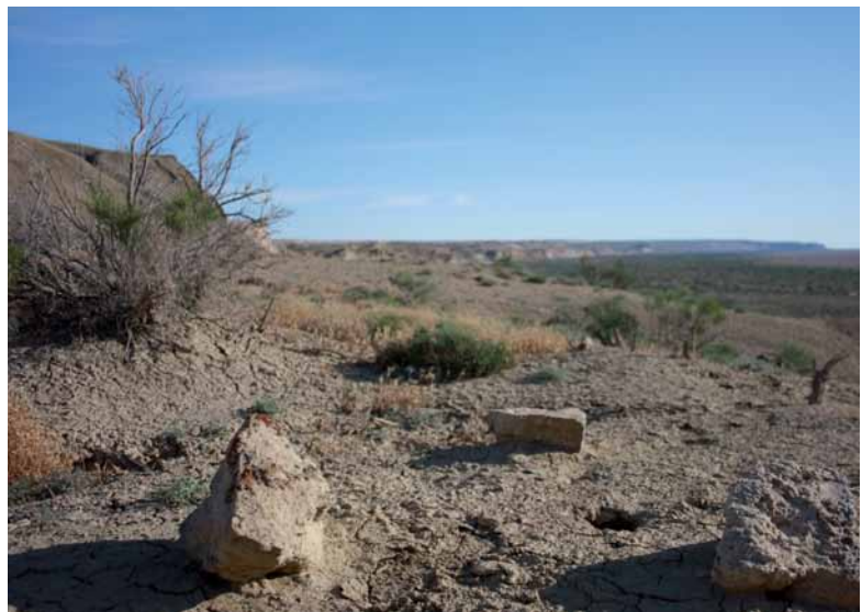
Wasserknappheit in Zentralasien wird voraussichtlich in Zukunft zunehmen.

Aufforstung spielt global bereits eine wichtige Rolle für die Abmilderung des Klimawandels, zum Beispiel als Strategie zur Speicherung von Kohlenstoff, welche im Rahmen des Clean Development Mechanism (CDM) unter dem Kyoto Protokoll eingesetzt wird. Der CDM ermöglicht es Industrieländern ihre Emissionsziele zu reduzieren, indem