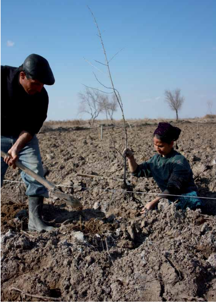
Aufforstungsprojekt auf degradiertem Ackerland in Usbekistan.

werden können, besonders für unproduktives Ackerland. Alternative Lösungen sind daher gefragt.