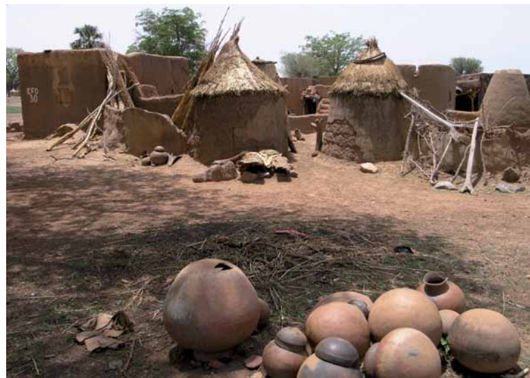
Klimawandel in Westafrika wird das Leben der Menschen dort immer mehr beeinflussen.

Die lokalen Radiosender spielen eine wichtige Rolle im Leben der Menschen in Westafrika – so auch in Ghana. Sie können und sollten daher mittels einfacher aber regelmäßiger Programme über den Klimawandel berichten. So könnten Medienvertreter dazu beitragen, das Thema Klimawandel auf die Agenda zu setzen.