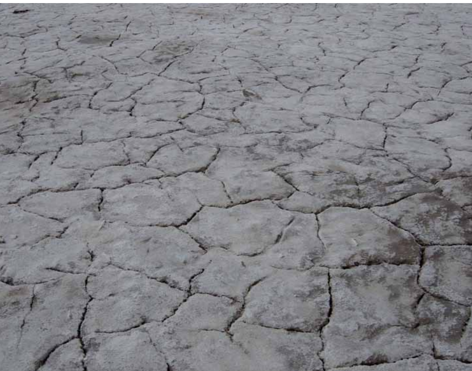
Durch Bodenversalzung degradiertes Ackerland in Usbekistan.

Zwischen 33% und 96% der bewässerten landwirtschaftlichen Flächen in Ländern wie Kasachstan, Turkmenistan und Usbekistan sind bereits versalzt. Die am meisten betroffenen Gebiete sind damit für die Landwirtschaft verloren. Die Nutzbarmachung von übermäßig versalztem Land mittels Auslaugen erfordert viel Wasser und die Instandhaltung teurer Entwässerungssysteme. Laut Berechnungen der Weltbank wird die Wasserknappheit in Zentralasien zwischen 2005 und 2050 über 500% zunehmen. Dies bedeutet, dass solche technischen Lösungen unrentabel