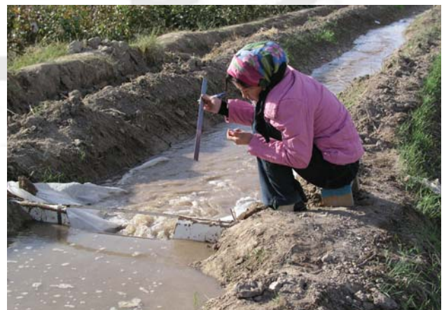
Eine Analyse von verfügbarem Wasser war Teil der Modellentwicklung.

erstellt werden. Da die erforderlichen Informationen nicht von einer einzelnen usbekischen Behörde zur Verfügung gestellt werden konnten, wurden die relevanten Daten aus verschiedenen Quellen zusammengestellt. Die Volkswirtschaft Usbekistans wurde anschließend in 20 Sektoren aufgeteilt, wobei der Agrarsektor in sieben und der Industriesektor in zehn Untereinheiten dargestellt wurde. Baumwollverarbeitung und Textilindustrie waren für die Studie die wichtigsten Kategorien, aber auch Informationen zu Wassernutzung war ein weiterer Teil der Datensammlung. Neben der physischen Verteilung des zur Verfügung stehenden Wassers auf die verschiedenen Ackerkulturen wurde auch ein Wertindikator für Wasser geschätzt. Im Falle Khorezms bewegt sich dieser mit 0.06 bis 0.06 US$ pro Kubikmeter im Bereich der Wassergebühren in Ländern wie Tunesien und Zypern. Ein Vergleich zwischen naturgegebenem Wasserangebot und landwirtschaftlicher Wassernachfrage in der Region Khorezm ermöglichte es abzuschätzen wie hoch die