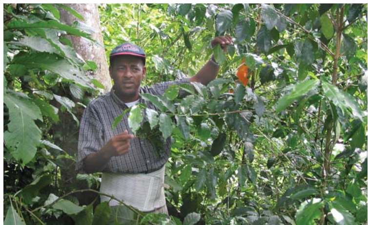
Kaffee ist das wichtigste Exportprodukt für Äthiopien.

Äthiopien ist der weltweit siebent größte Kaffeeproduzent. Damit ist Kaffee das wichtigste Exportprodukt für Äthiopien (ein Drittel davon geht nach Deutschland) und bildet 40% des nationalen Fremdwährungseinkommens. Der Kaffeesektor verschafft dem Land etwa 15 Millionen Arbeitsplätze. Äthiopiens Kaffee (z.B. Harar, Sidamo, Yirgacheffe, aber auch der Wildkaffee) gehört zu den besten