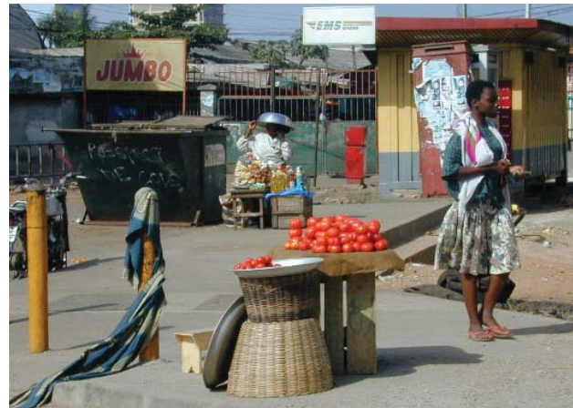
Kleine landwirtschaftliche Betriebe sind von der neuen Richtlinie betroffen.

Es gibt daher kein allgemeingültiges Fazit, ob Entwicklungsländer Gewinne erzielen oder Verluste erleiden werden unter der neuen Richtlinie. Dies ist abhängig