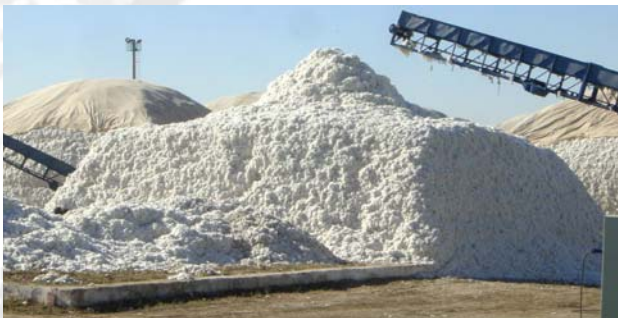
Baumwolle ist der zweitgrößte Teilsektor der Landwirtschaft in Usbekistan.

Der Autor hat am ZEF seine Doktorarbeit zu dem Thema verfasst und ist nun als Senior Researcher im Projekt „Ökonomischer und ökologischer Wiederaufbau in Khorezm, Usbekistan“ tätig. Kontakt: Marc.mueller@uni-bonn.de