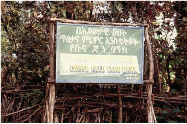
Kaffee Feldgenbank bei Choche Im Südwesten Äthiopiens.

Kaffees der Welt. Einzelhandelspreise können bis zu 10 EUR/250 Gr. reichen. Äthiopien exportiert diese Kaffees jedoch oft nur geringfügig über Erzeugerpreisen. Derzeitig kommen dem äthiopischen Kaffeesektor nur 6% der Einzelhandelspreise für Spezialitätenkaffee zugute, was gerade die Produktionskosten deckt.