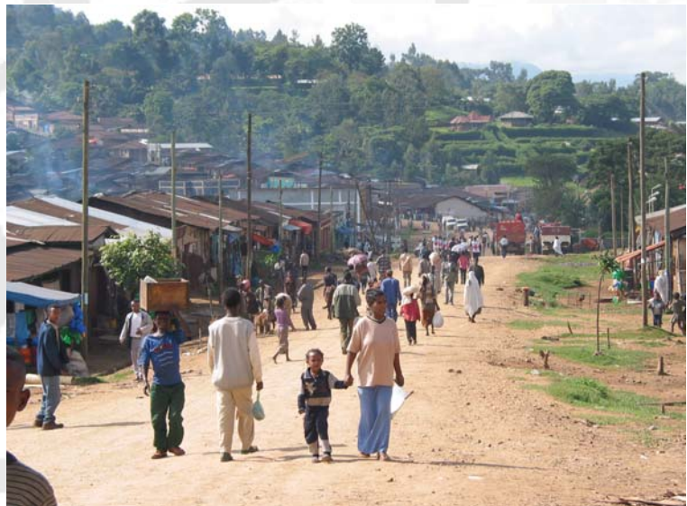
Der Wildkaffee-Genpool ist u.a. durch Bevölkerungswachstum bedroht.

Von zentraler Bedeutung für die zweite Phase des Projektes war die Gründung des „Ethiopian Coffee Forest Forum“ (ECFF), einer Nichtregierungsorganisation, die Ende 2005 offiziell in Äthiopien registriert wurde. Das ECFF spielt eine Vermittlerrolle zwischen Wissenschaft, Politik und der Zivilgesellschaft. Das ECFF ist nicht nur eine Plattform für die Zusammenarbeit der verschiedenen Interessengruppen, sondern es wird auch Aufgabe des ECFF sein, Öffentlichkeitsarbeit im weitesten Sinne durchzuführen und Ausbildungskomponenten für unterschiedliche Interessengruppen zu entwickeln. Vor allem wird das ECFF konkrete Schutzmaßnahmen für Wildkaffee initiieren.