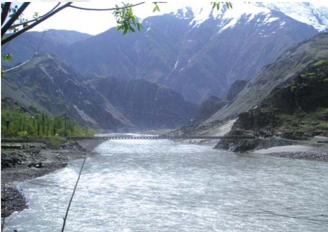
Brücke zwischen Afghanistan und Tadschikistan.

Grenzen haben mehrere Funktionen. Als Symbole von Souveränität markieren sie territoriale Herrschaftsräume. Staaten demonstrieren ihre Macht und Kontrollfähigkeit, indem sie Grenzzäune und Kontrollpunkte errichten und Grenzwatchen einsetzen. Durch Grenzen gelangen Güter, Menschen, Ideen und Informationen in ein Territorium. Nur in voll integrierten Gebieten ist der Eintritt frei. Ansonsten wird in Form von Zöllen, Lizenzen, Gebühren und Visa ein Eintrittspreis erhoben, wodurch Grenzen auch spezifische Einkommen hervorbringen.