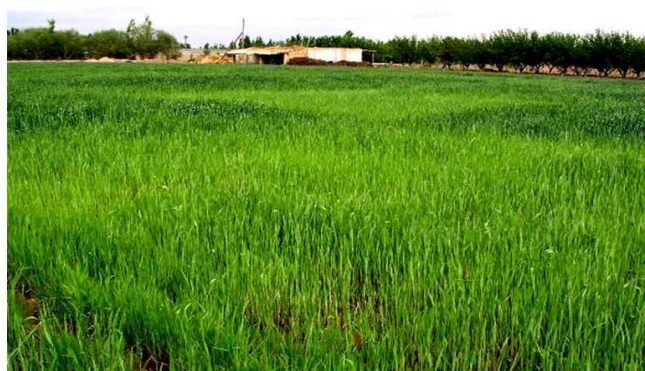
4-Расм. Азотли ўғитлар турли меъёр ва муддатларда қўлланилганда кузги буғдой даласи

Тадқиқот натижаларига кўра, кузги буғдой етиштиришда ўғитлаш ишлари юқорида қайд этилган тавсиялар буйича амалга оширилса, юқори дон ҳосили олишга имконият яратилади ва аҳолининг буғдойга бўлган талаби қондирилади. Аммо буғдой дони сифатини янада яхшилаш лозим. Хоразм вилоятининг донни қайта ишлаш корхоналарида ун ишлаб чиқарилиши учун мўлжалланган буғдойнинг дон сифати кўрсаткичлари қаторида протеин ва клейковина миқдорлари аниқланади. Чорва озуқа учун мўлжалланган буғдойда сифат кўрсаткичи тариқасида фақат оқсил миқдори аниқланади. Илмий изланишларимиз натижалари кўрсатишича, буғдой дони юқори даражада азот ўзлаштиришига эришиш орқали унинг сифатини яхшилаш мумкин. Масалан, ўсимликни бошоқлаш даврида қўшимча азотли ўғитлаш дон таркибидаги азот ва ўз навбатида протеин миқдоринини оширди (4-расм). Бундан ташқари, сувни меъёридан ортиқча ишлатмасдан, суғориш ишларини фақат буғдойнинг талабига биноан (масалан, туплаш, поя узайиши, гуллаш, доннинг сут пишиши ва тўлиши каби танг даврларда) ўтказиш ўсимликлар азот ўзлаштиришини яхшилайти ва оқибатда ўғитлардан фойдаланиш самарадорлигини оширади.