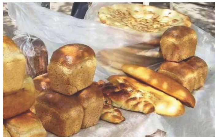
1-Расм. Хоразм вилояти Урганч шаҳри бозоридаги нон маҳсулотлари

Ўзбекистонда нон маҳсулотлари асосан кузги бугдой донидан ишлаб чиқарилади. Бу экин мамлакатнинг суғориладиган дехқончилиги учун нисбатан янги экин ҳисобланади ва Ўзбекистон қишлоқ хўжалигига 1990 йилларнинг ўрталарида қабул қилинган озиқ-овқат билан ўз-ўзини таъминлаш миллий Дастури асосида кенг қўламда жорий қилинган. ZEF/UNESCO лойиҳаси фаолият кўрсатаётган Хоразм вилоятида бугдой етиштириш майдони 1990-2003 йиллар оралиғида 37 минг гектардан 86 минг гектаргача кенгайтирилди. Бунинг учун бир қатор амалий тадбирлар бажарилди: ғўза ва ем-хашак экинлари майдонлари бир мунча қисқартирилди ва бугдойзорларга айлантирилди. Ғўза каби суғориладиган майдонлардаги кузги бугдой фермерлар томонидан давлат буюртмаси асосида етиштирилади. Ушбу иккита экин турларини етиштирувчи фермерларни давлат қўллаб-қувватлайди ҳамда субсидия ва кредитлар билан таъминлайди.